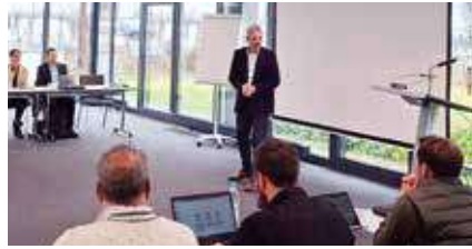
Rückblick auf das 13. GST Schwertransportgespräch