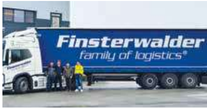
E-Mobilität im Härtetest