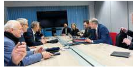
Transportbranche setzt auf Zusammenhalt und Zukunftsfähigkeit 41