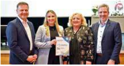
80 Jahre LBT-Feier 6