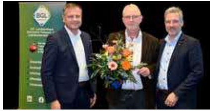
80 Jahre LBT-Feier – Ehrungen 12