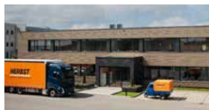
Zu Besuch im neuen Firmengebäude der Firma Herbst in Bamberg 36