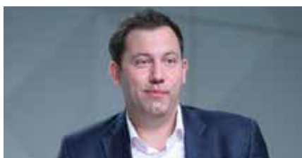
Steuer-Entlastungspaket: Bundesregierung will Investitionen ankurbeln 23