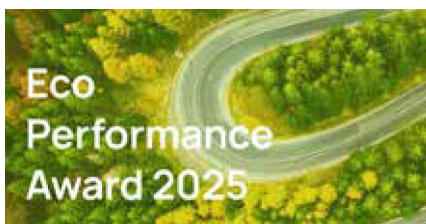
Eco Performance Award 2025 34