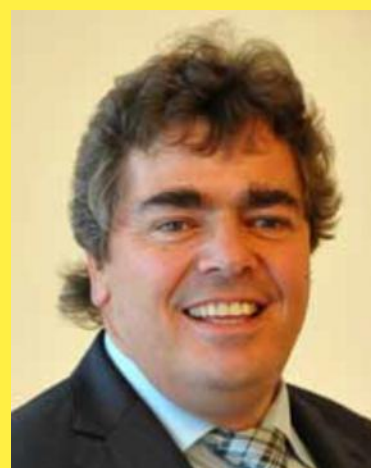
Präsident Rolf Hamprecht